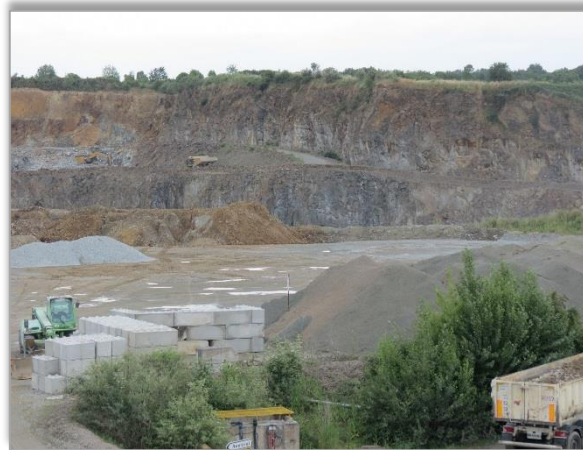
Site d'extraction Carrières – Mozé-sur-Louet