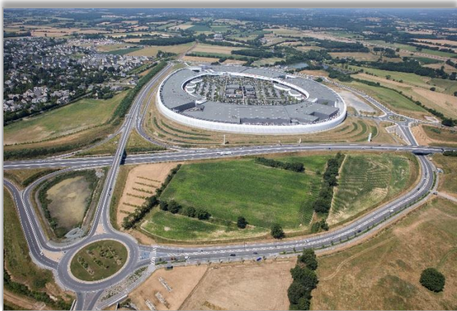
Aménagement d'une zone d'activité à vocation commerciale Atoll - Beaucouzé

Projets = Programmation territoriale, équipements, infrastructures, aménagement ou réaménagement